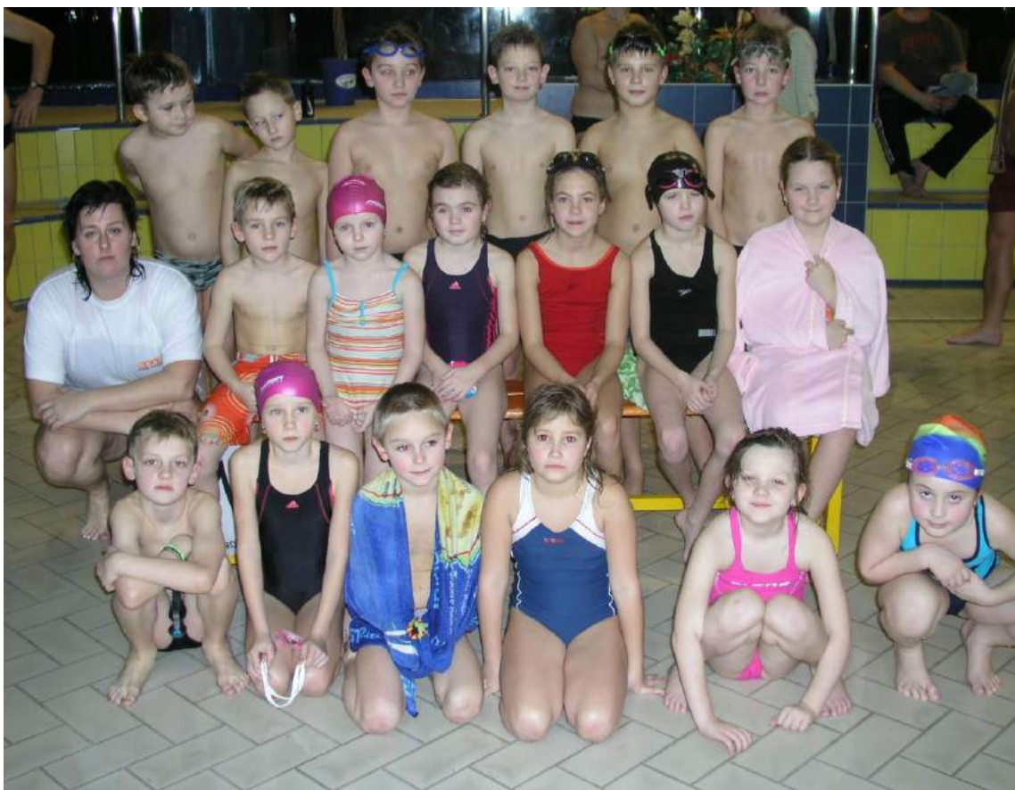
Oddílové závody 19.12. - družstvo C