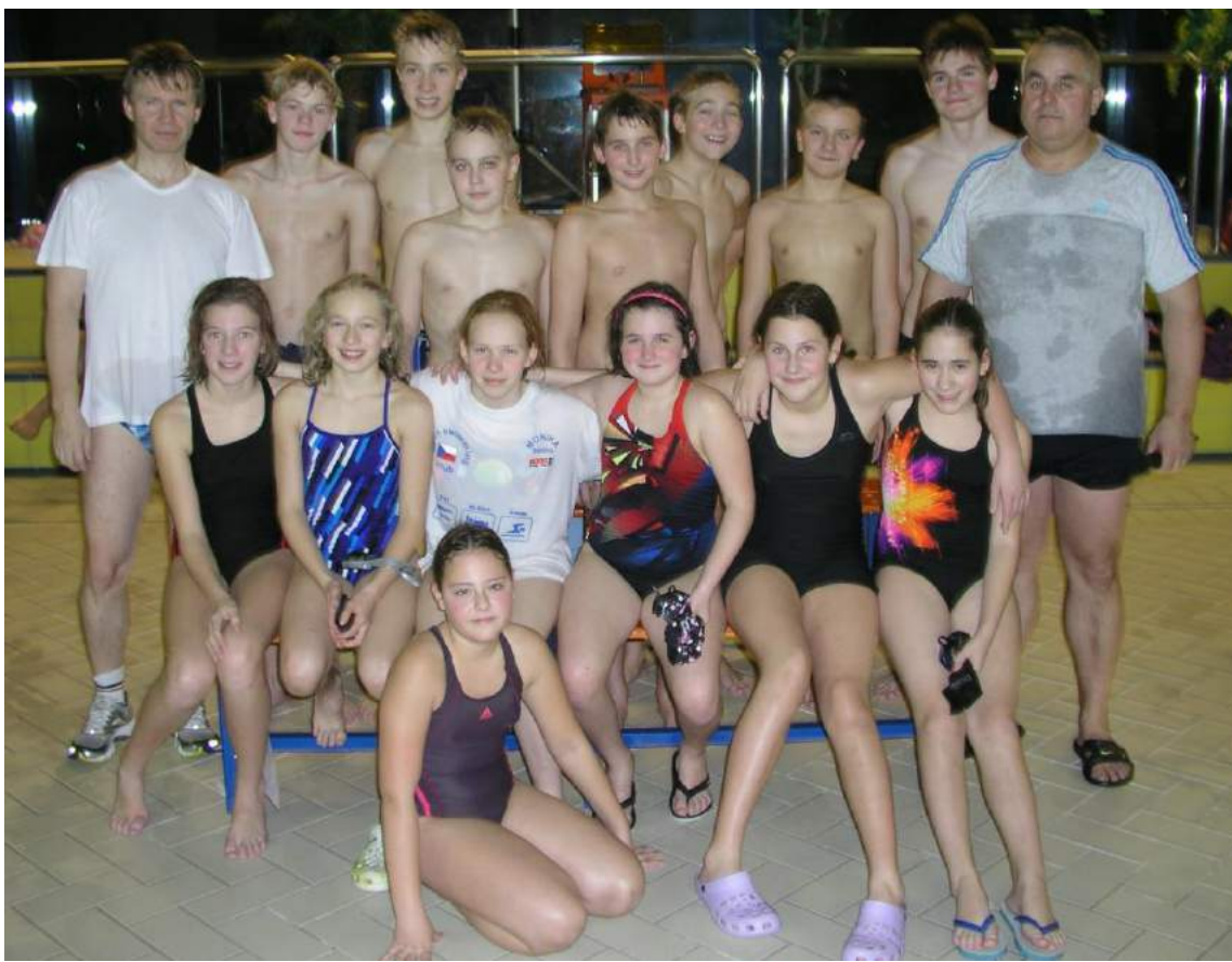
Oddílové závody 19.12. - družstvo A