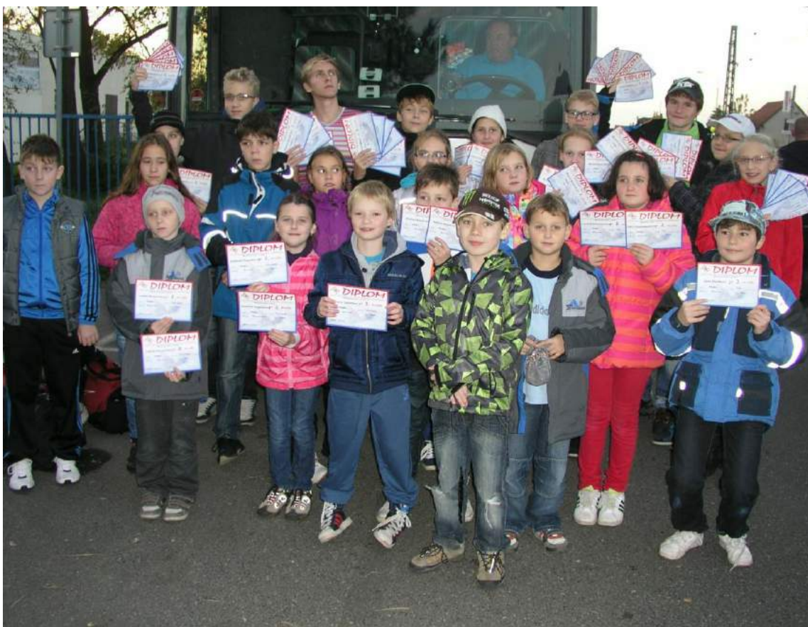
Meziokresní přebory - Mělník 19.10.