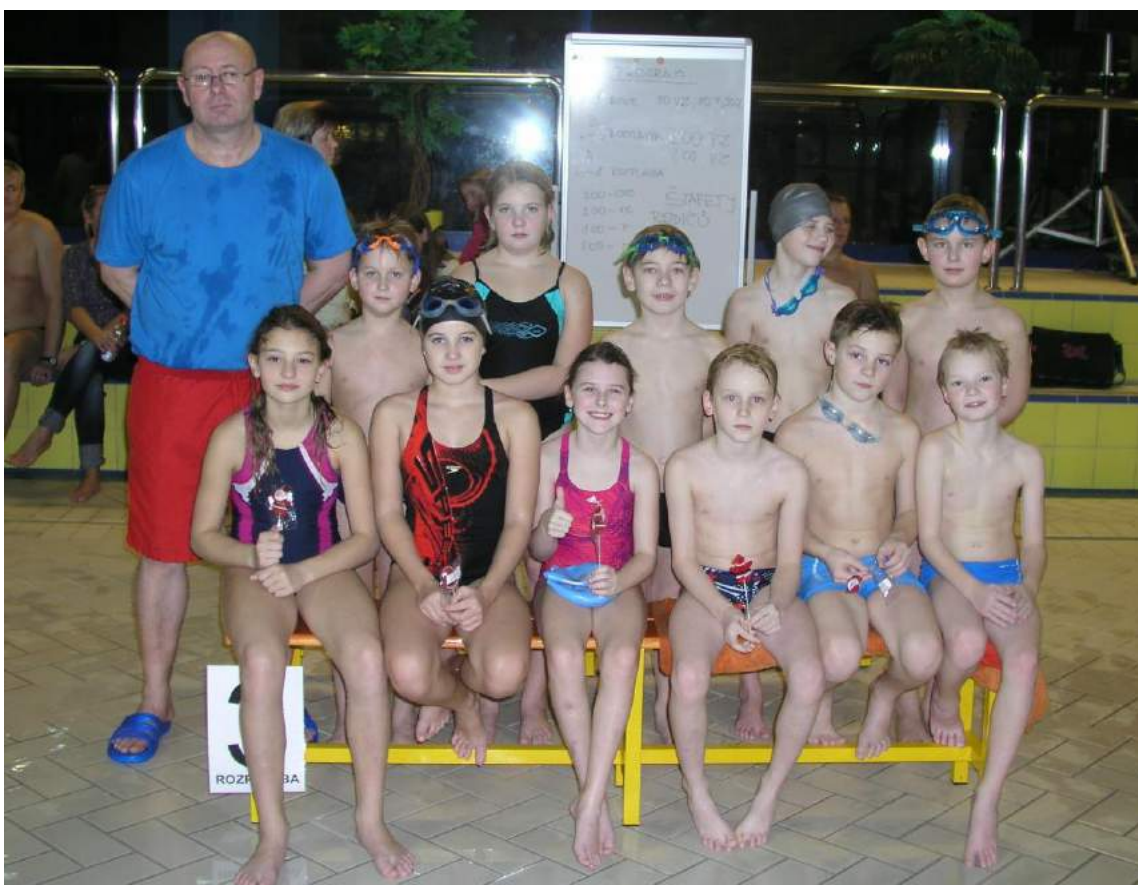
Oddílové závody 19.12. - družstvo B