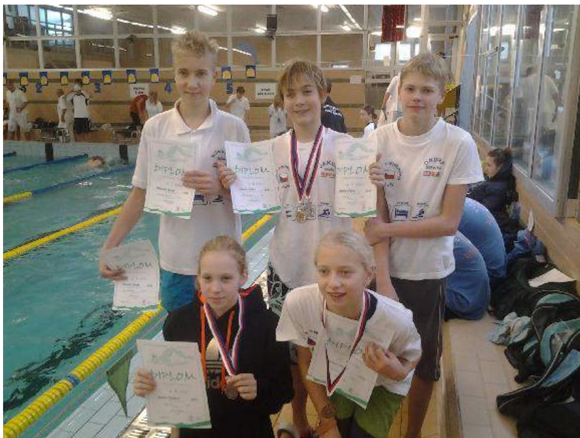
Litoměřice – Oblastní přebor 12-ti letého a staršího žactva – 23.11.