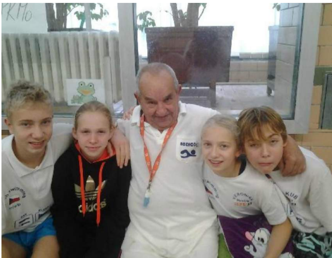
Litoměřice – Oblastní přebor 12-ti letého a staršího žactva – 23.11.